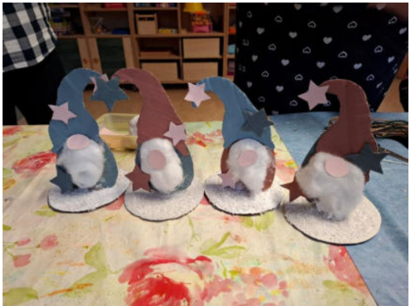
Sehr schön entstandene Wichtelmännchen