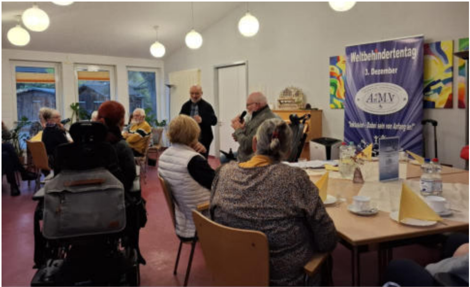
Fotos: K. Köster (Bild oben) Herr Köhler wird als Pfleger Angehöriger geehrt und Frau Rossek (unten) ebenfalls.